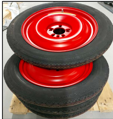
Bild1+2: Universal-Lackierräder von F&S Technik GbR, Lochkreise für Räder von 14 Zoll bis 22 Zoll

Mit der Anschaffung einiger weniger Reifensets ist es möglich, auch bei mehreren, parallel auszuführenden Aufträgen jedes Fahrzeug mit Lackierrädern auszustatten.