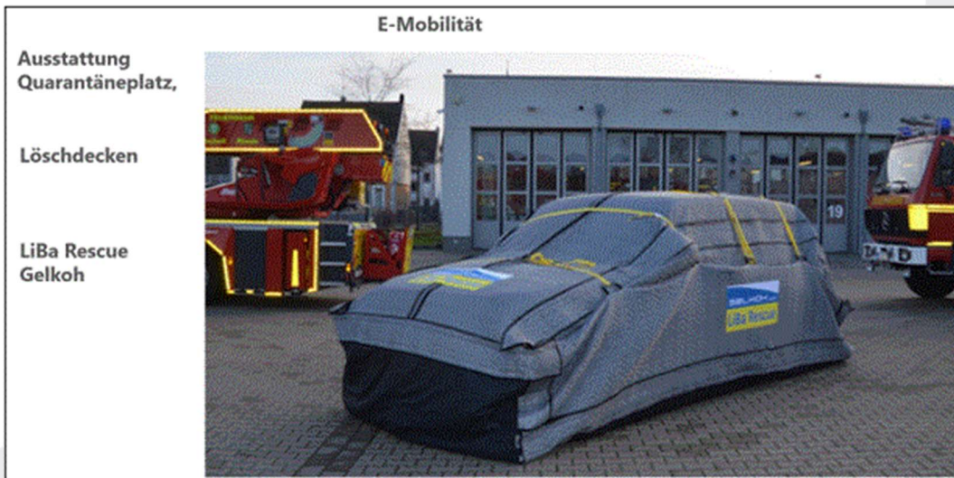
Bild 4: LiBa Rescue Bergesystem: sichere Quarantänesituation

Haben Betriebe regelmäßig verunfallte HV-Fahrzeuge zur Reparatur, kann ggf. die Investition in weitere Schutzsysteme wie z. B. speziell für HV-Fahrzeuge entwickelte Löschdecken sinnvoll sein.