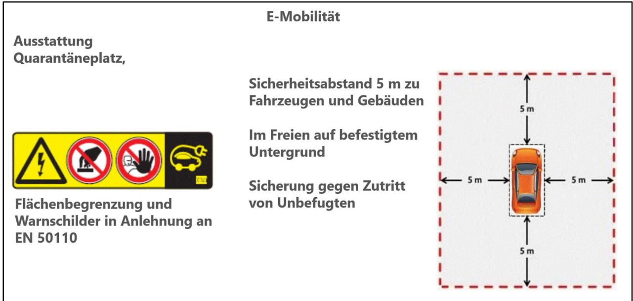
Bild 3. Quarantäneplatz-Empfehlung für Standort, Maße, Abstände, Ausstattung, Kennzeichnung

Quarantänestellplatz HV-Fahrzeuge: Derzeit gibt es keine gesetzlichen Forderungen, jedoch Empfehlungen von Berufsgenossenschaften und Verbänden über die Mindestanforderungen.